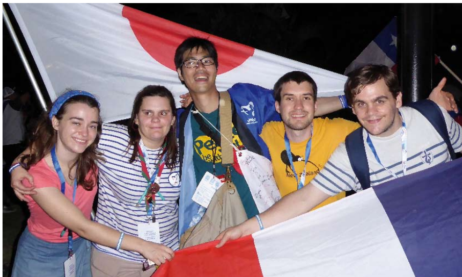
Des jeunes du Loiret au Panama pour les JMJ en janvier dernier